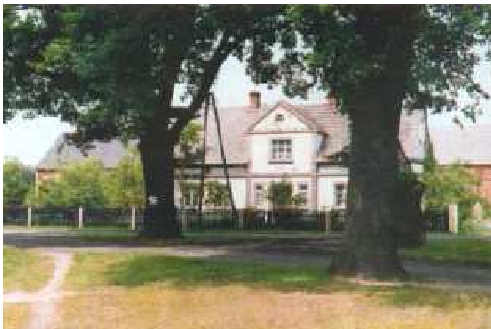
Murowany Dom z 1942r. w środku wioski gdzie dawniej stała dzwonnica.

Objęte nadzorem konserwatora zabytków jest również 25 budynków mieszkalnych i gospodarczych.