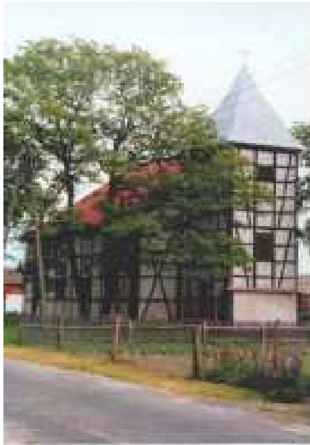
Kościół z 1842r.

Wieś Lipno położona jest na pięknie ukształtowanym terenie w malowniczym kompleksie leśnym pełnym grzybów i zwierzyny. Do podstawowych i najważniejszych zasobów Lipna zaliczyć należy przede wszystkim obiekty zabytkowe, które znajdują się we wsi. Na terenie miejscowości niewątpliwie perłą jest zabytkowy XIX wieczny kościół, który wzniesiono od podstaw w latach 1841-1842.